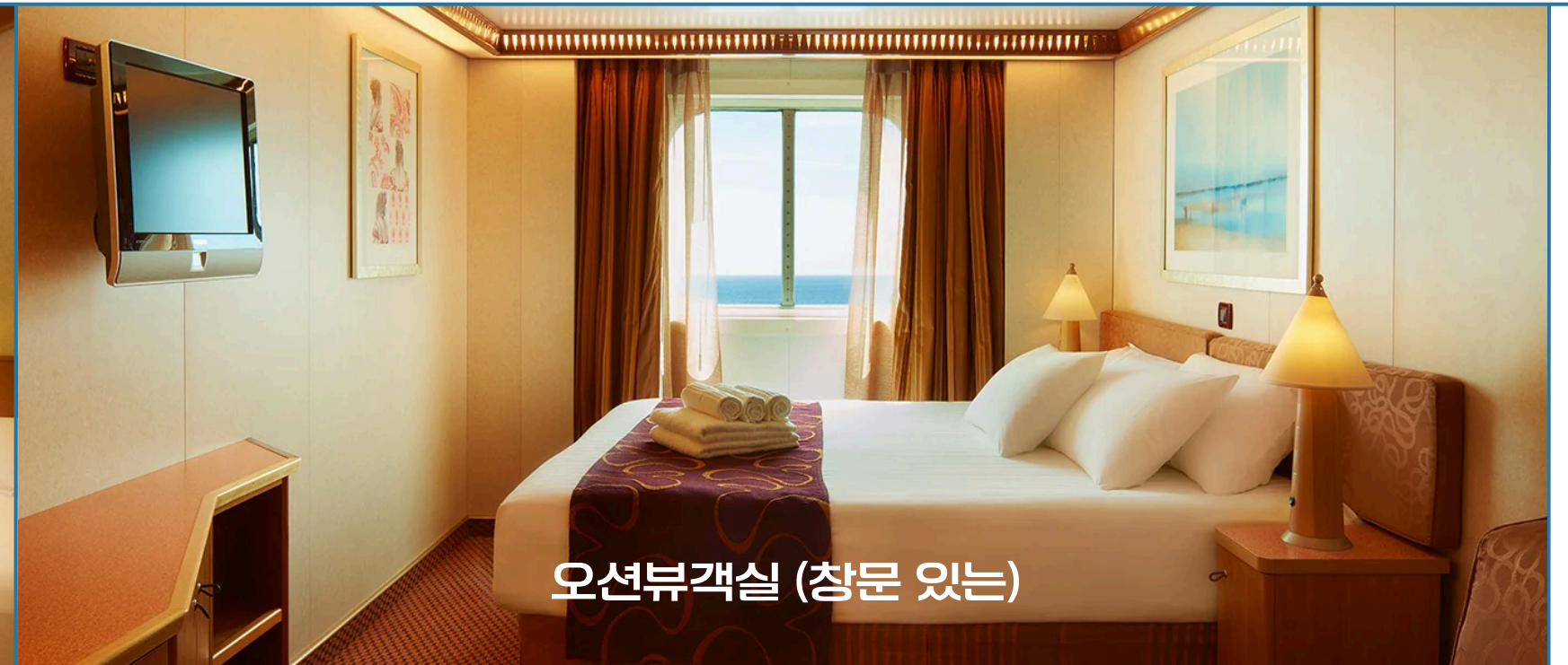
오션뷰객실 (창문 있는)